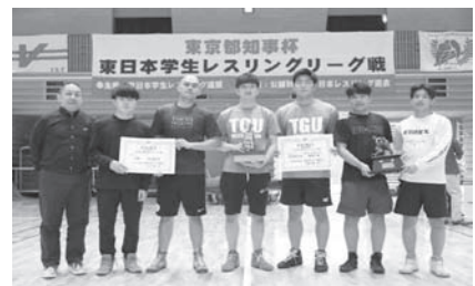
▲二部リーグ優勝の学連選抜チーム