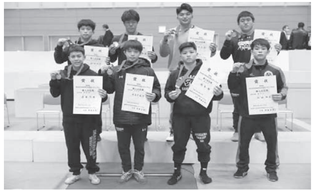
▲個人戦優勝選手(前列左から後列右へ階級順)