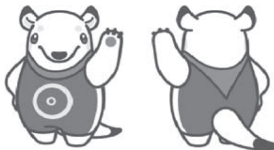
▲お友達キャラクター「あーりん」