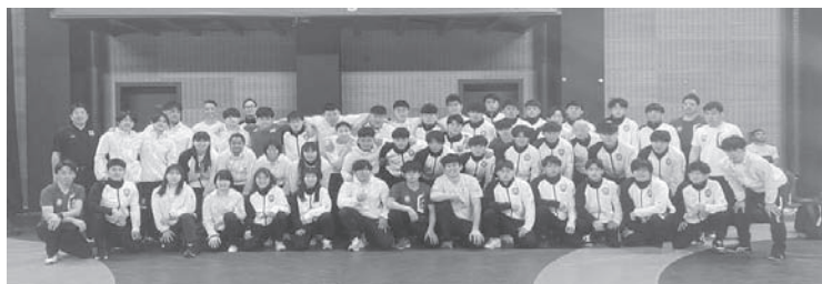
▲全日本学生連盟と西日本学生連盟による学生選抜チーム