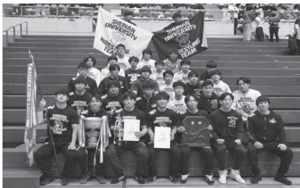
▲5季連続優勝の周南公立大