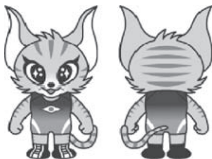
▲メインキャラクター「レスにゃん」

公募によって決定した日本レスリング協会公式キャラクターのメインキャラクター「レスにゃん」、お友達キャラクター「あーりん」