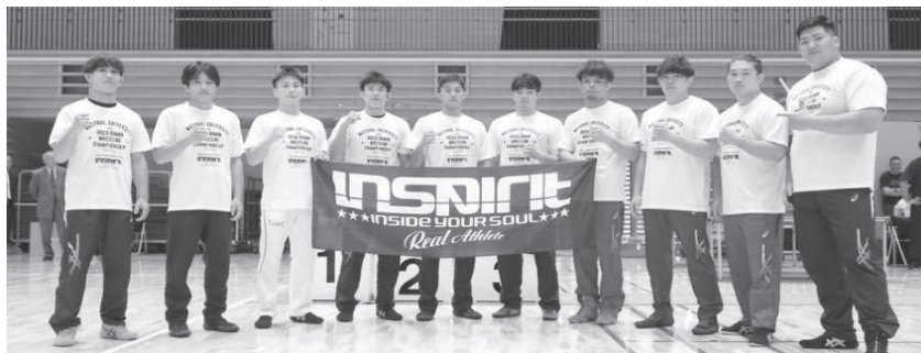
▲各階級優勝選手。左から階級順

《大学対抗得点》[1]日体大 74点、[2]育英大 45点、[3]拓大 44点、[4]中大 43点、[5]早大 39点、[6]神奈川大 30点、[7]専大 27点、[8]国士館大 21点