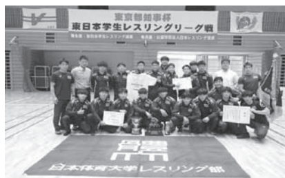
▲一部リーグ優勝の日体大